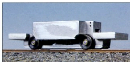
Joc. 85.001 Chassis-moteur H0m Joc. 85.001 Gemotoriseerd chassis H0m

Joc. 84.000 2 poteaux par sachet + 2 textes différents bilingues Joc. 84.000 2 palen per verpakking + 2 verschillende tweetalige teksten Joc. 84.004 2 Anzeigenmaste mit je zweimal zwei verschiedene Tekste