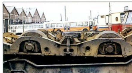
Bogie type N / Type N draaistel Type N Drehgestell

Joc. 81.005 Motrice type N / Bientôt livrable Joc. 81.005 Type N motorrijtuig / Binnenkort leverbaar.