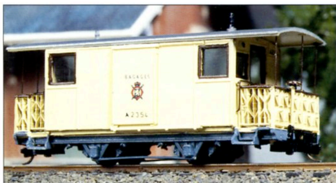
Joc. 81.106 Fourgon SNCV / NMVB Bagagerijtuig / Gepäckwagen

Joc. 81.005 Type N Triebwagen der N-Klasse / In Kürze lieferbar